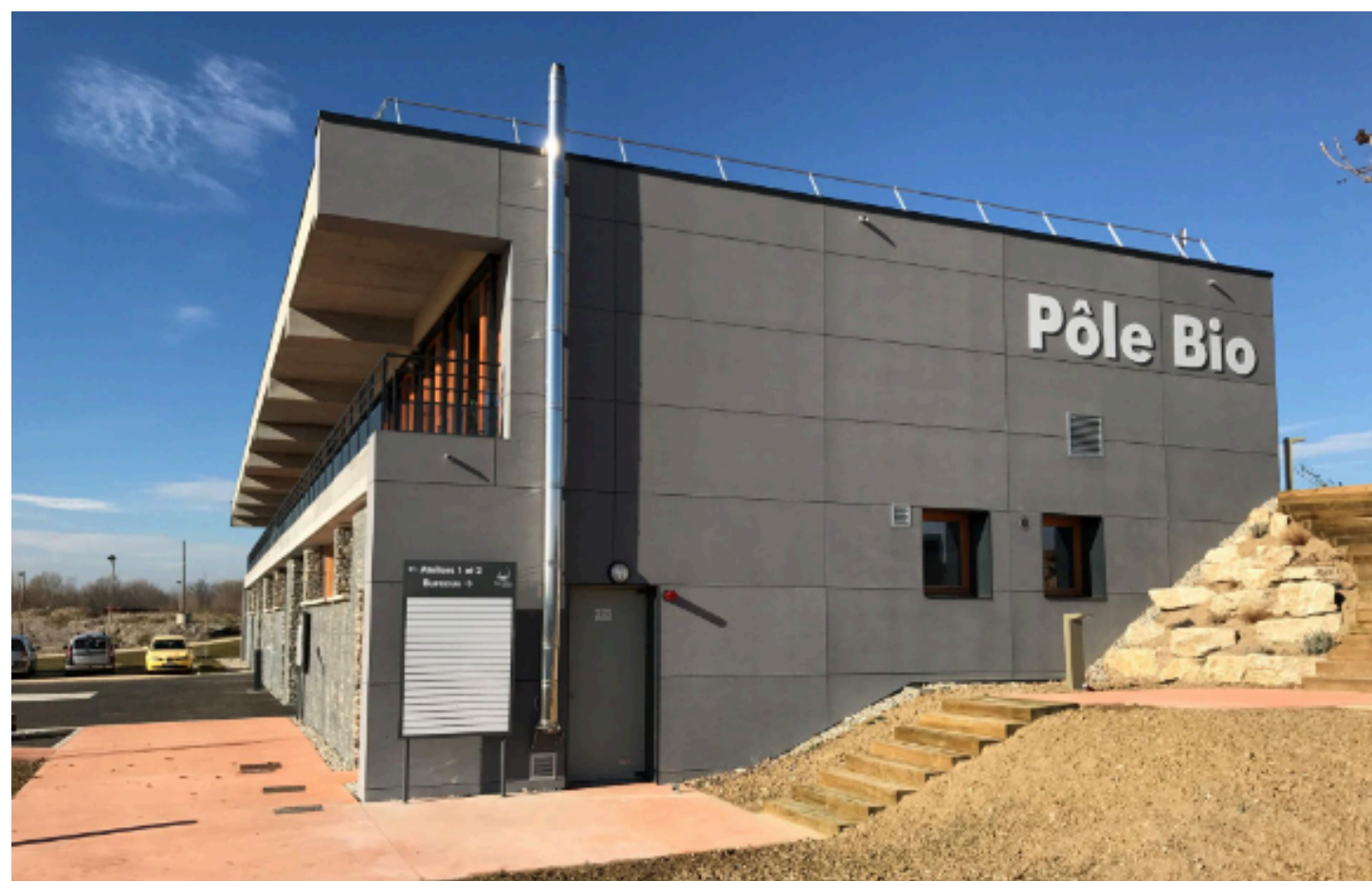
Pôle bio de la CCVD