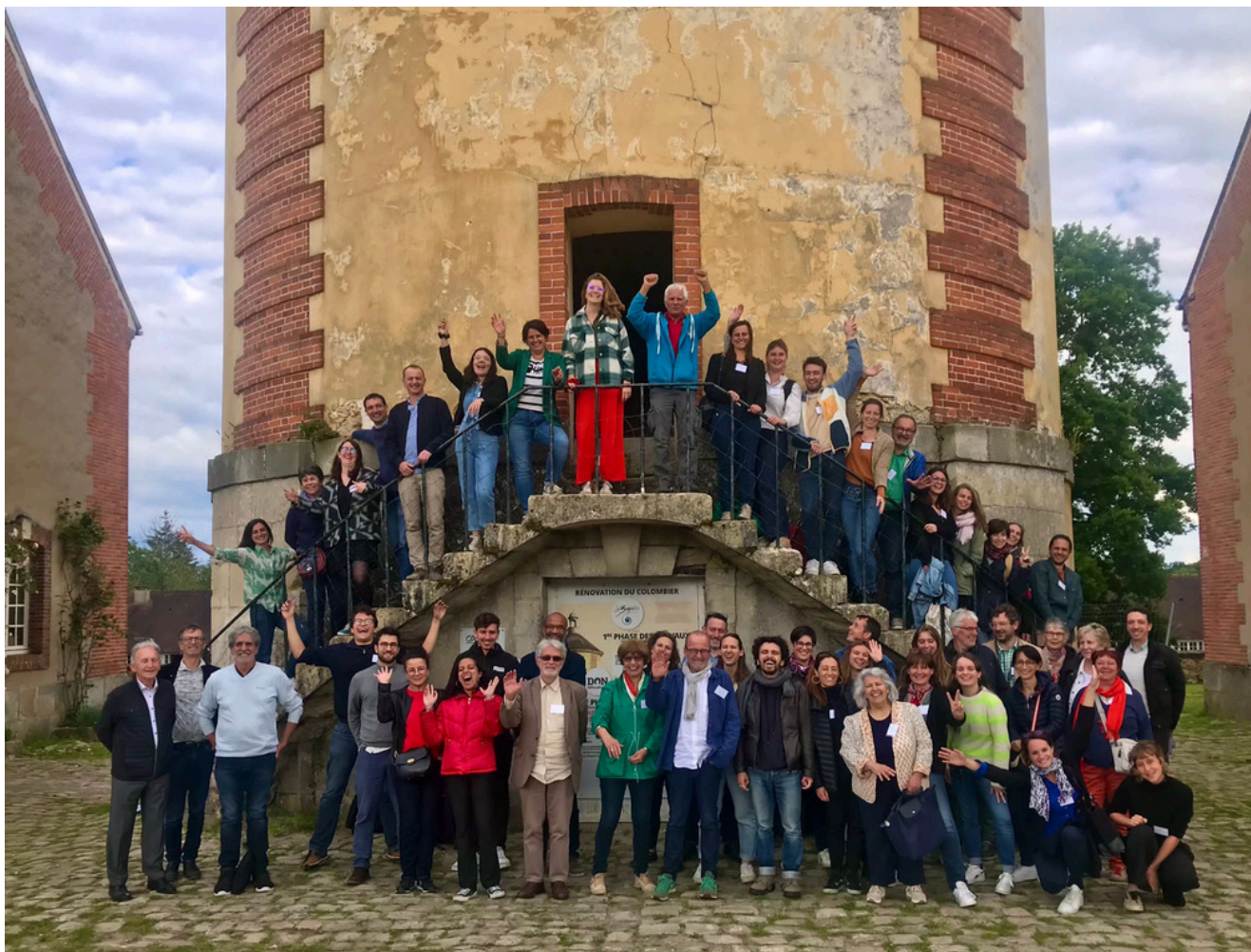
Séminaire des territoires TETRAA - Rambouillet, 2024

« Faire partie d'un réseau apporte du bien être : revoir les mêmes personnes dans un esprit convivial, partager les difficultés, s'inspirer. » Territoire TETRAA