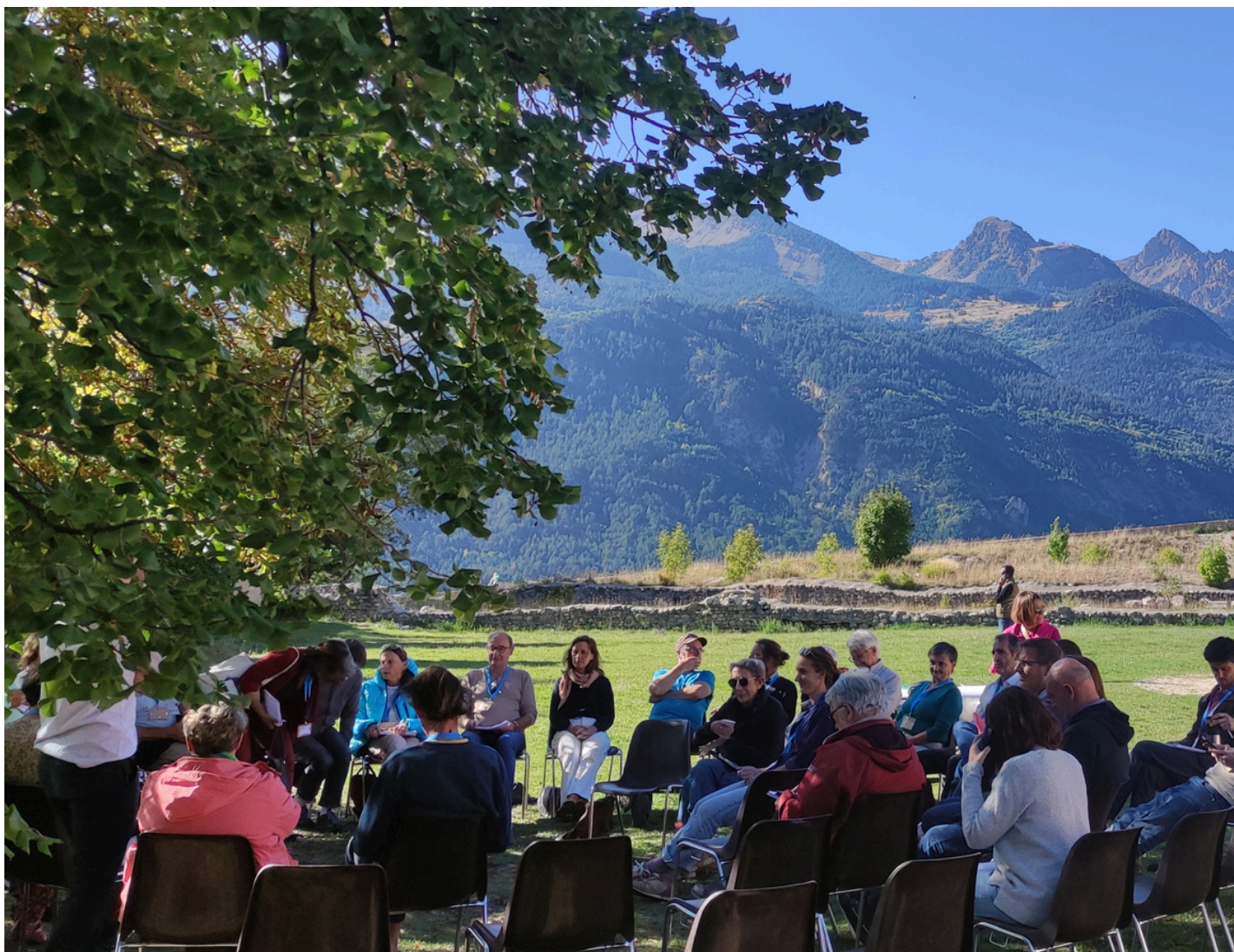
Formation des élus - Mont-Dauphin, 2023