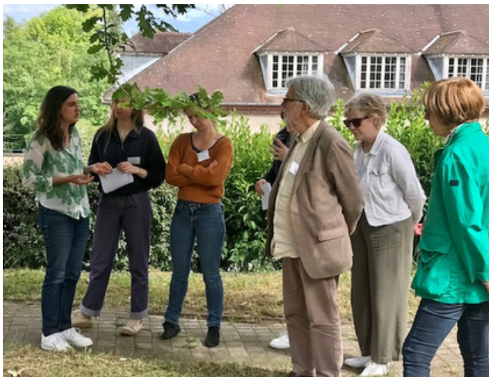
Séminaire des territoires TETRAA - Rambouillet, 2024

« On est allé toucher des acteurs nouveaux par rapport à ceux qui étaient déjà là » .Territoire TETRAA