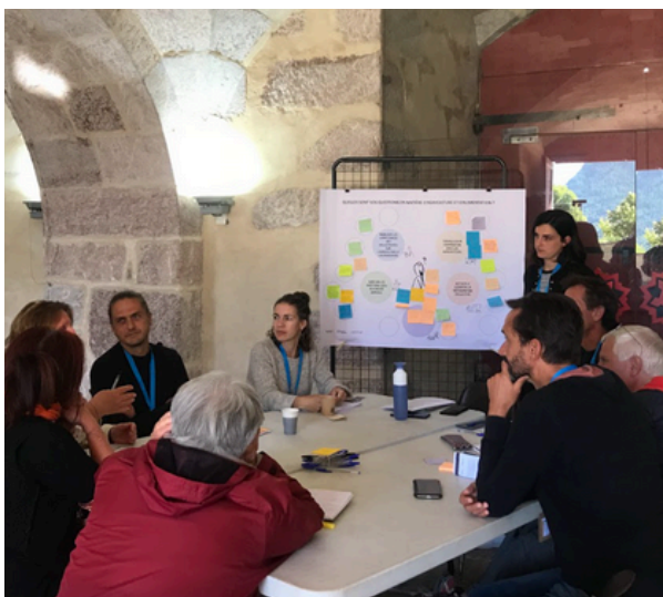
Formation des élus - Mont-Dauphin, 2023

« Une gouvernance basée sur un groupe de partenaires et un pool d'experts, c'est rare et stimulant ». Territoire TETRAA